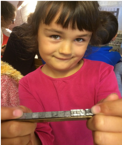
On compose sa première ligne d'imprimerie,