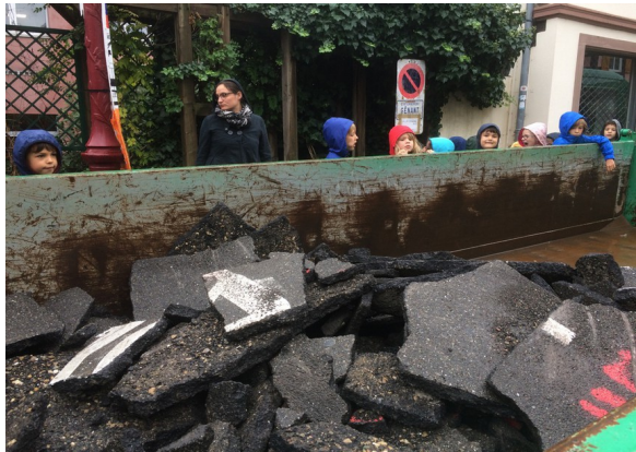
... ou d'énormes plaques de bitume.