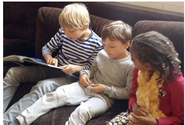
on lit des livres aux copains,