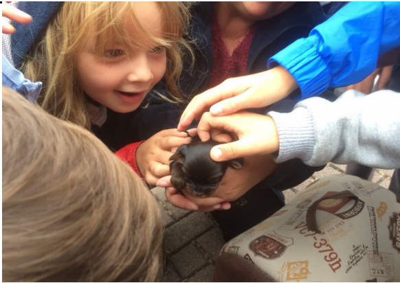
On admire un tout petit chiot...