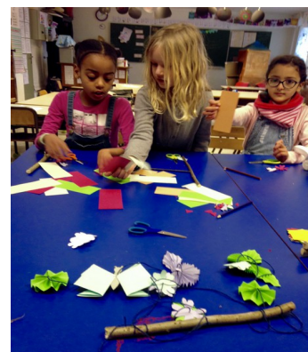
atelier branches de printemps,