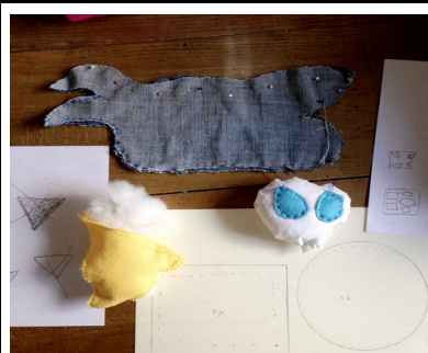
atelier doudous en couture,